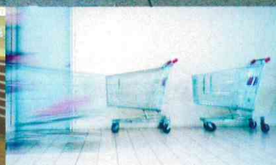
Warenpräsentation: Eine innere Logik entwickeln