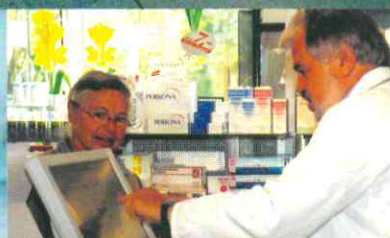
Platz sparen: Freie Kapazitäten für den Zusatzverkauf schaffen