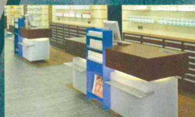
Planung: Alle relevanten Kriterien auf einer Checkliste